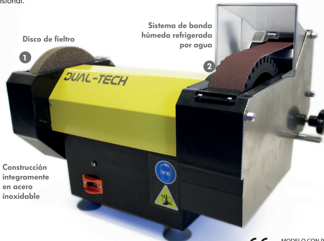
Disco de fieltro